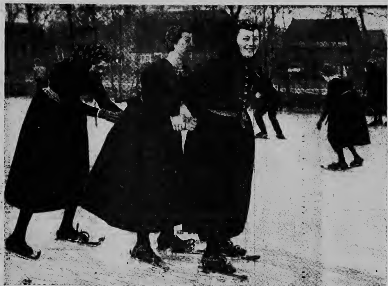
STAPHORST TA BAI CORRE SCHEUGELS. — Awor cu invierno ta cohiendo terreno i cu na tur camina nos ta contra cu gruponan cu ta corre schaats, naturalmente nan no quier queda tras na Staphorst. Den e trajenan cu a queda te ainda aya un tradicion, e corredorinan di schaats ta bulando over di ijs. Aquí nan no ta papia di corre schaats, ma di corre scheugels, loque ta nifica mescos.

E amonestacion a worde entrega door di embahador ruso na Roma Kozlyef, na e ministro-italiano di relaciones exteriores, Segni.